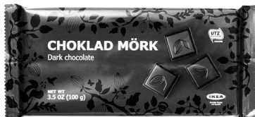
CHOKLAD MÖRK 60%

IKEA retira barras de chocolate CHOKLAD MÖRK 60% y CHOKLAD MÖRK 70% por presencia no declarada de leche y avellanas